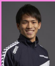
きよのコーチ ふせやコーチ